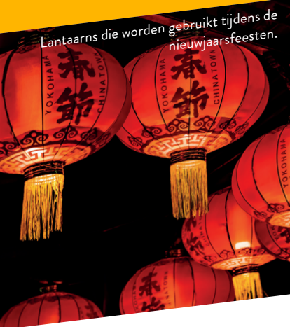
Lantaarns die worden gebruikt tijdens de nieuwjaarsfeesten.

In het zuiden van Peru wordt de geboorte van Jezus op z'n 'creools' gevierd met traditionele dansen, uitgevoerd op muziek met Afrikaanse invloeden.