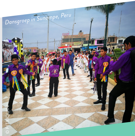
Dansgroep in Sunampe, Peru

In Bulgarije blijven de restanten van het christelijk kerstmaal de hele nacht op tafel staan zodat ook de overleden voorouders kunnen dineren.