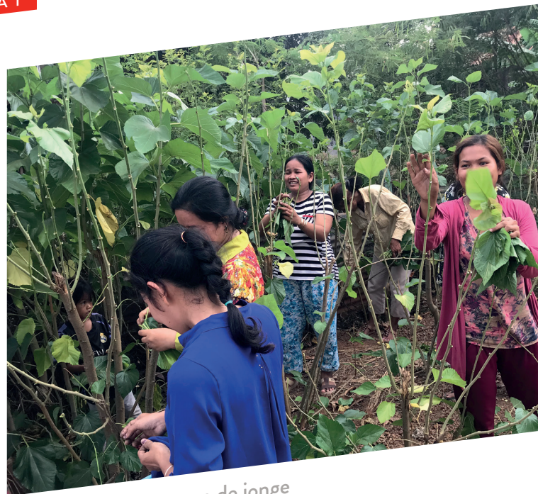
Vrouwen in de weer om de jonge moerbeibomen te verzorgen.

De oprichters van het Center blijven ambitieus. Zo willen ze een meer aanleggen om waterlelies